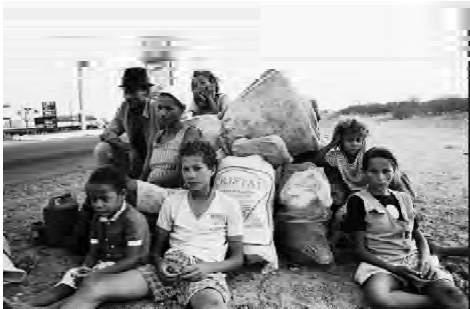
Família de retirantes do nordeste brasileiro fogem da seca desta região