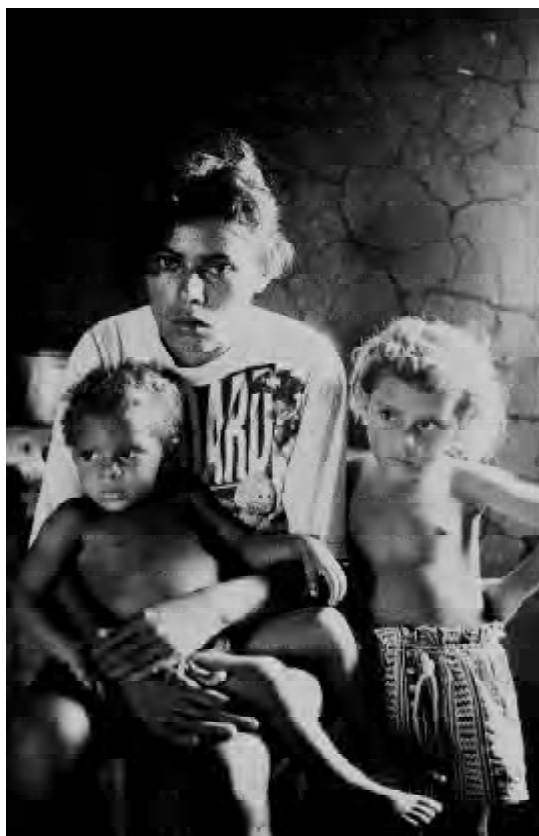
Seca no nordeste brasileiro