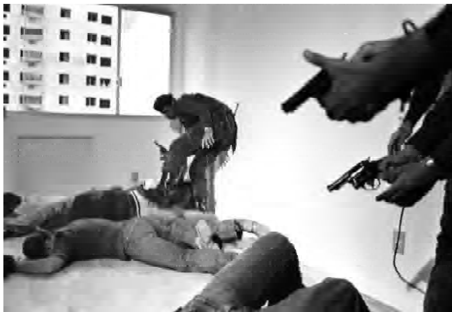
Treino da Polícia Militar para dar flagrante