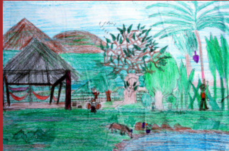
Dados do aluno