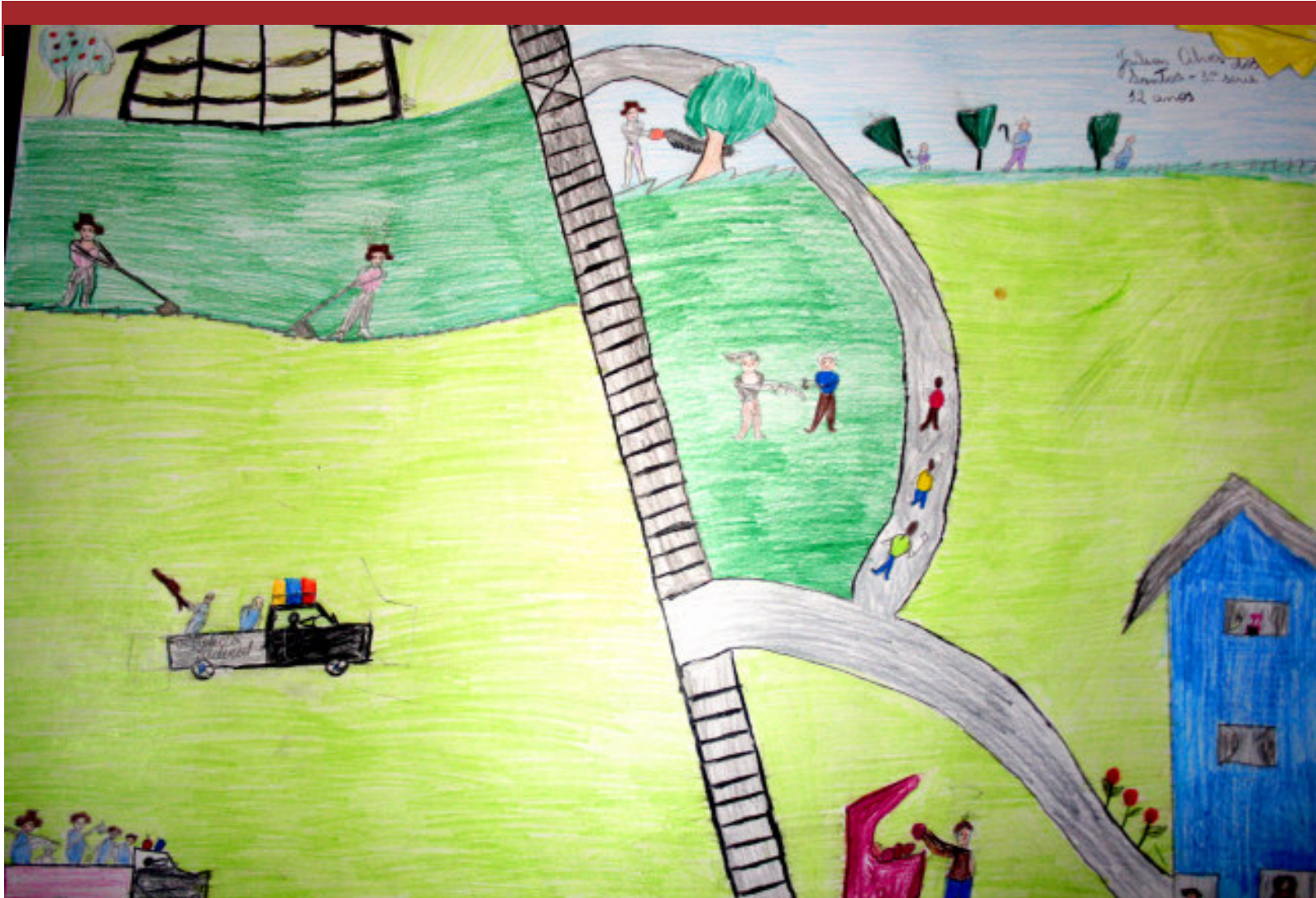
Dados do aluno