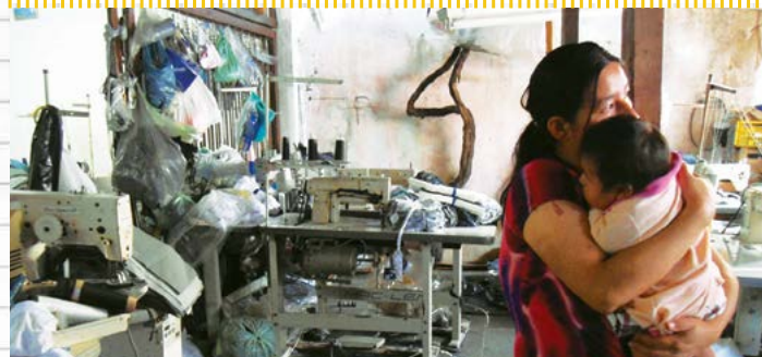
Trabalhadores moravam com suas famílias onde costumavam durante jornadas exaustivas (Oficina fornecedora da Fenomenal/2012)

JORNADA EXAUSTIVA >> Os costureiros chegam a operar máquinas por 16 horas seguidas, já que o pagamento, geralmente, é feito por peça produzida, cujo valor é muito baixo.