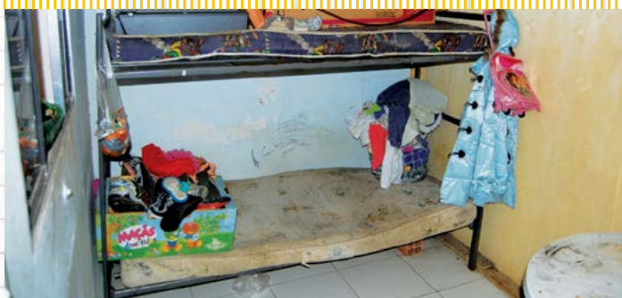
Dormitório de costureiros na oficina de costura (Oficina fornecedora da Renner/2014)

CONDIÇÕES DEGRADANTES >> As oficinas servem de alojamentos para os costureiros e suas famílias inteiras. O ambiente é precário e insalubre.