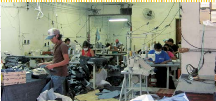
Situação precária do local de trabalho de costureiros (Oficina fornecedora da Zara/2011)

TRABALHO FORÇADO >> A retenção de documentos, as ameaças de deportação, além de pressão psicológica, e até violência física, podem ser usadas para coagir trabalhadores ao serviço.